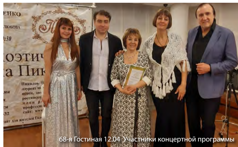
68-я Гостиная 12.04 Участники концертной программы