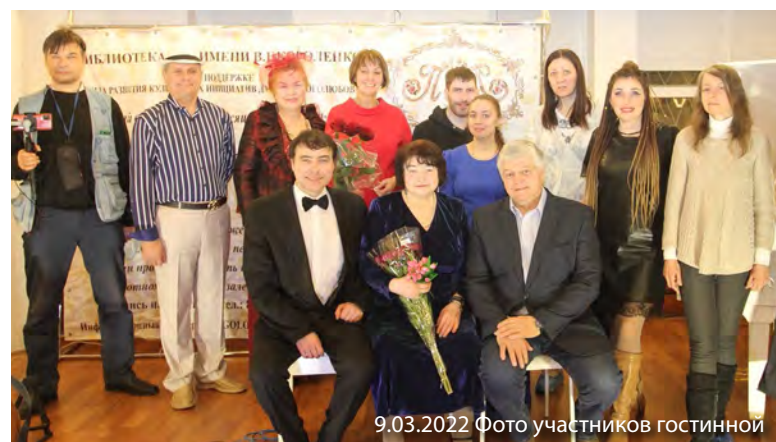
9.03.2022 Фото участников гостиной